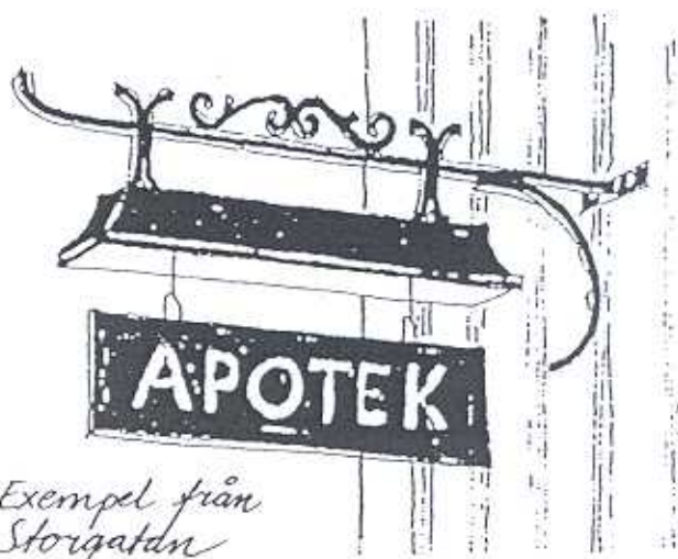
Exempel från Storgatan