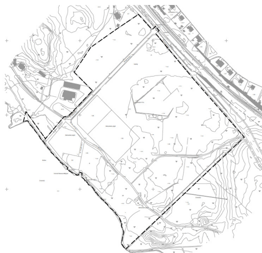
Utsnitt som visar upphävandet