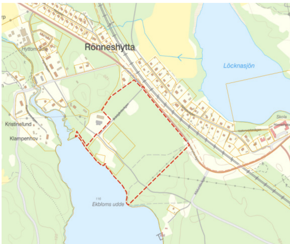
Aktuellt område för upphävande av detaljplan visas inom det röstreckade området.

Inom planområdet finns 6 fastigheter. Fastigheterna Rönneshytta 1:35, 1:63 och 5:6 ägs av Askersunds kommun. Rönneshytta 1:65 och 1:64 är i privat ägo.