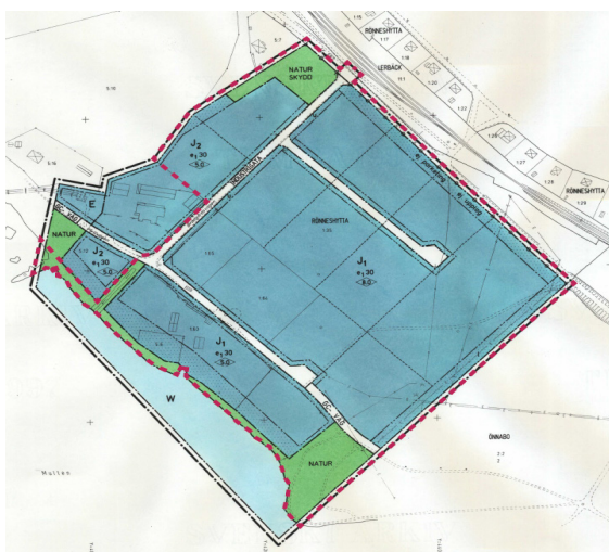
Utsnitt som visar gällande plan

Direkt nordväst om planområdet finns en verksamhetslokal och bebyggelsen nordväst om detta består av bostäder. Öster om planområdet sträcker sig järnvägen och norr om denna finns bostadsbebyggelse.