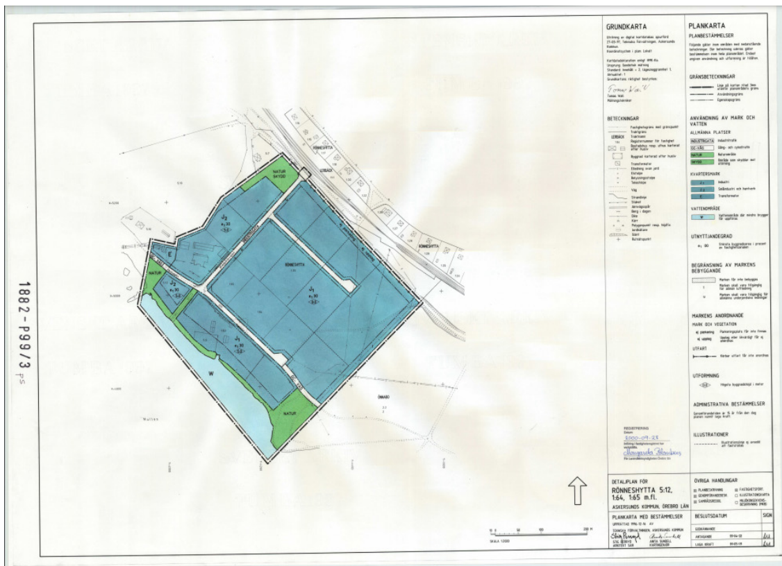
Gällande plan (1882-P99/3)

om norrlandsgränsen till södra Sveriges dynfält med sina tydliga spår av sekundär omformning.